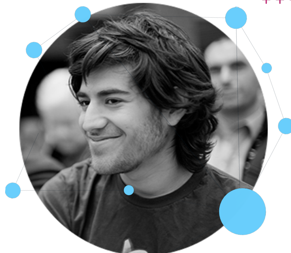
Aaron Swartz, 1986 - 2013